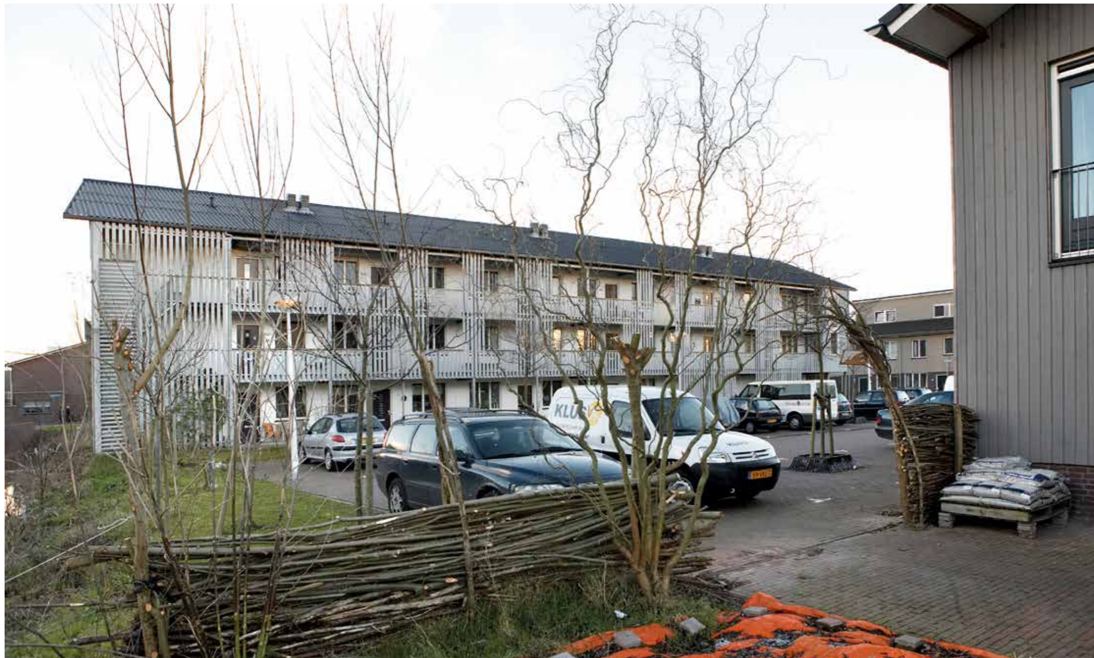
EEN GEMENGDWONENPROJECT VAN CORPORATIE PORTAAL IN UTRECHT VOOR DRAGENDE EN VRAGENDE BEWONERS.

C orporatie Portaal is al geruime tijd bezig met 'gemengd wonen'. In Utrecht heeft Portaal acht verschillende woonprojecten waar verschillende huurders, met en zonder psychische problematiek, samen wonen. Soms in een nieuwbouwcomplex, soms in een leegstaand gebouw, soms zelfs ook in een bestaand complex. Dat vereist zorgvuldigheid van de corporatie en veel gesprekken met de mensen die er al wonen. Het is moeilijk om een geschikte locatie te vinden. Medewerkers van Portaal zoeken naar locaties samen met de gemeente en organisaties voor maatschappelijke opvang.