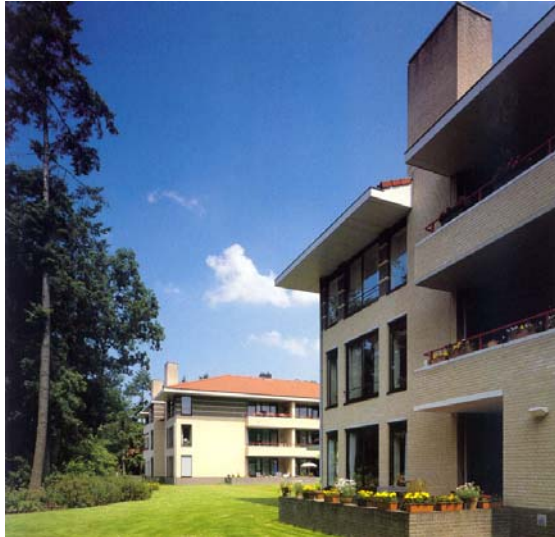
Park Finspong Zeist

Het oudste Altusproject is bijna 10 jaar oud. Sinds die tijd zijn 11 projecten gerealiseerd, met in totaal circa 600 woningen. De projecten liggen verspreid in het land. Voor een overzicht van de projecten, zie www.altus.nl . Er zijn twee nieuwe projecten in ontwikkeling. Het streven is om per jaar twee nieuwe projecten op te leveren.