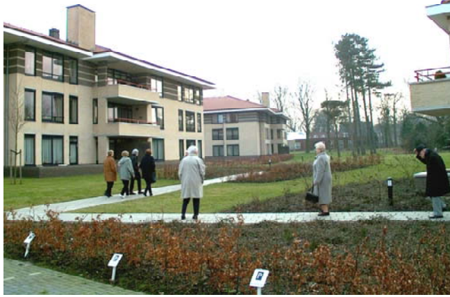
Park Finspong Zeist

Het Altus-concept is vraaggestuurd, maar tegelijkertijd is de opzet zo, dat dit niet veel extra tijd, inzet en deskundigheid vergt van de bewoners. Het beheren van de VvE vraagt geen extra inspanningen, want dat is een wettelijke verplichting voor appartement-eigenaren. Desgewenst wordt het algemene VvE-werk uitbesteed aan een professionele bestuurder. Ook komt het voor, dat er externe bestuursleden voor de VvE worden aangetrokken, bijvoorbeeld kinderen van de bewoners. Altus Woonzorgdiensten begeleidt de VvE bij de extra taken op het gebied van service en zorg.